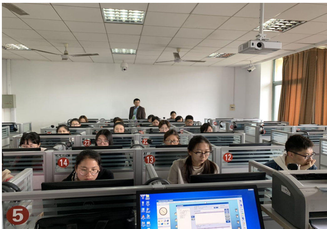
第二届全国大学生公共卫生综合知识与技能大赛网络初赛

本届大赛初赛共有60所高校参赛，选拔出30所高校进入决赛。决赛将于2019年5月18日在广东珠海举行。