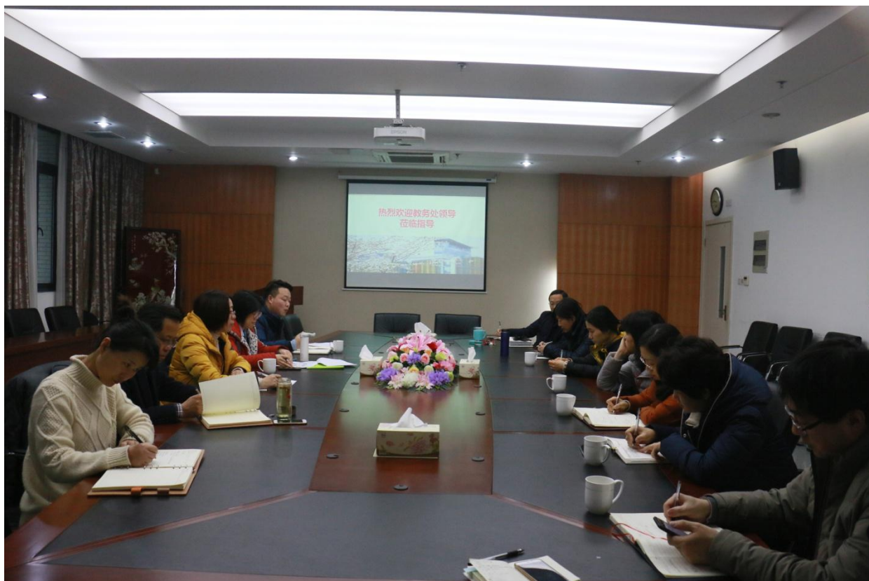
教务处与公共卫生学院教师代表就全面振兴本科教育进行座谈