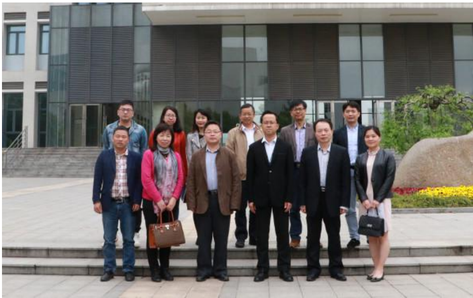
福建医科大学来访交流