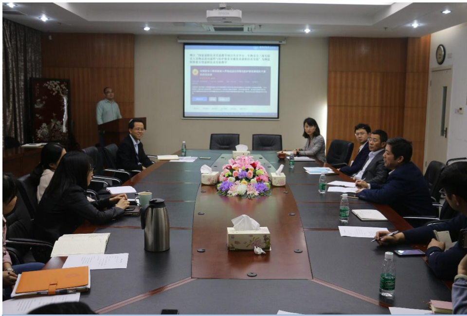
虚拟仿真专家论证会